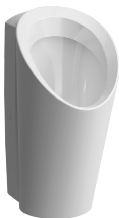
SLP 59 - LEMA