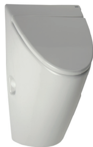
SLP 32 - ARQ cu capac