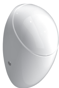
SLP 24 - ALESSI cu capac