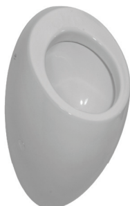
SLP 25 - ALESSI fără capac