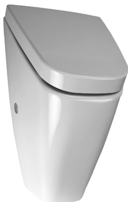
SLP 37 - VILA cu capac