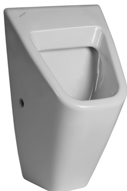
SLP 12 - VILA fără capac