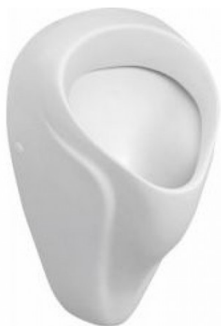
SLP 18 - NOVA PRO ALEX