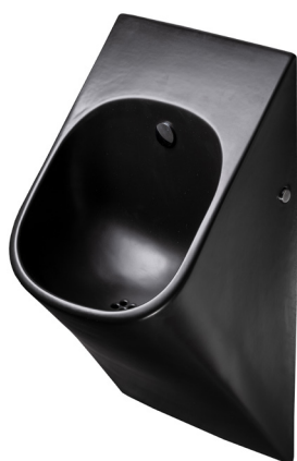
SLP 89S - LA FONTANA