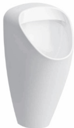
SLP 49 - CAPRINO PLUS RIMLESS