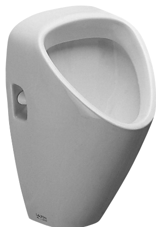
SLP 23 - CAPRINO