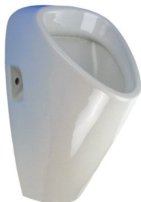
SLP 19 - GOLEM