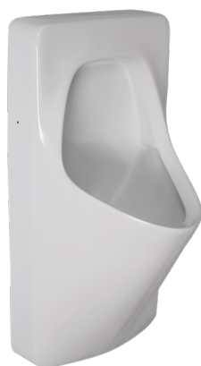
SLP 20 - ANTERO