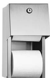
SLZN 26 95260 Dispenser de hârtie igienică din oțel inox