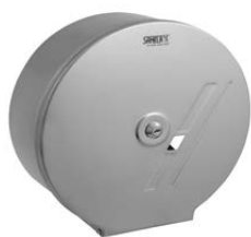
SLZN 01 95010 Dispenser de hârtie igienică din oțel inox