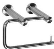
SLZN 47H 85474 Suport hârtie igienică din oțel inox