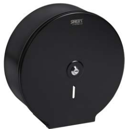
SLZN 37V 95372 Dispenser de hârtie igienică din oțel inox