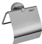
SLZN 09 95090 Suport hârtie igienică din oțel inox