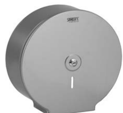
SLZN 37X 95371 Dispenser de hârtie igienică din oțel inox