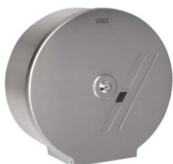
SLZN 37 95370 Dispenser de hârtie igienică din oțel inox