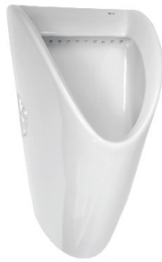
SLP 27 - CHIC