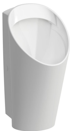
SLP 59 - LEMA RIMLESS