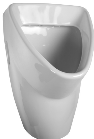
SLP 31 - LIVO