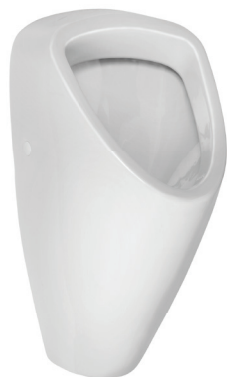
SLP 49 - CAPRINO PLUS